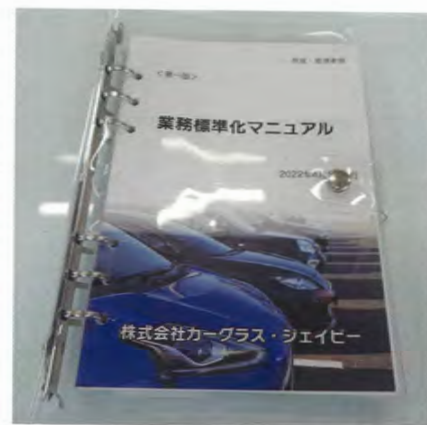
業務標準化マニュアルを作成した

電子制御装置整備への対応は新店舗だけではなく、全店舗で進めている。フロントガラス交換に伴う、カメラのエーミング作業は全店舗合計で月間450台の実績を持つ。ガラス修理事業者の認証取得は、事業を欠かせない要素の一つとなる。新型コロナウイルスの感染拡大などで整備主任者の資格取得講習を終えるまで時間を要したものの、認証は今夏をめどに全8店舗での取得完了を予定している。