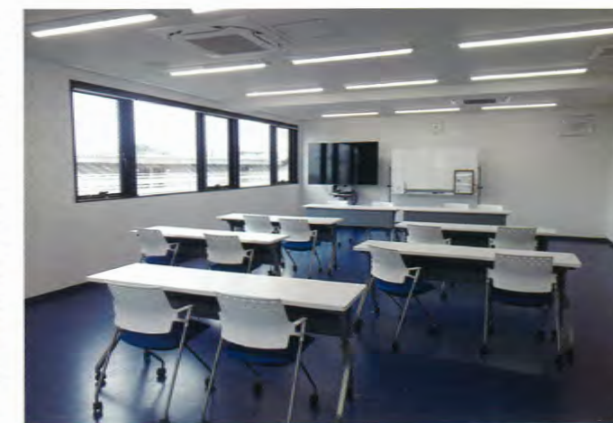
新入社員研修をOJTから集合形式に切り替えた

22年からはガラス交換に伴うカメラのエーミングだけではなく、ミリ波レーダーなどにも受注を広げている。取引先から「レーダー関連の相談や問い合わせが増えていく」(同)という。設備投資の負担が限定的だったこともあり、各店舗がターゲットのリフレクター(反射板)などを徐々にそろえ始めていく。ガラス修理業だからといってフロントガラス交換に伴う作業だけではなく、幅広いエーミ